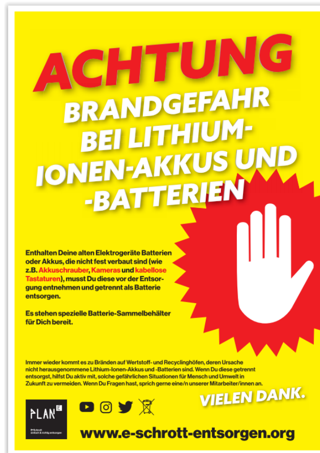
Abbildung 3: Plakat Lithium-Ionen-Akkus

Besonders hervorheben möchte ich das Thema Lithium-Ionen-Akkus. Das Plakat (siehe Abbildung 3) können Sie sich ebenfalls als Print bestellen oder downloaden.